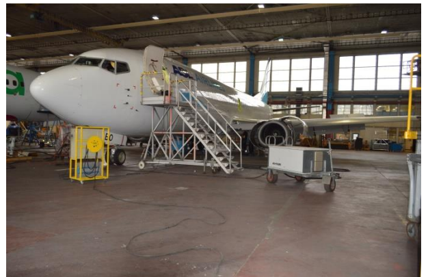
Uniek om te bezoeken: Loods H-08