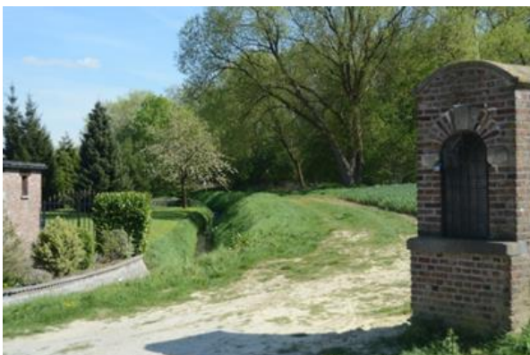
Kapelleke op het Imbroek

De 5km. De wandeling start in het centrum van Zaventem en gaat richting 't Imbroek. Het Imbroek is het oudste groendomein van Zaventem. Vandaar uit gaan de wandelaars langs mooie landelijke wegen naar Nossegem.