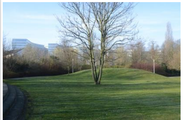
Park Mariadal & Crown Plaza Park