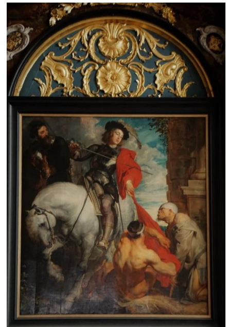
Schilderij Antoon van Dijck

De 5km komt langs de gekende Ikea-landingsbaan en loopt langs het 'Noskoem-wegske' terug naar de startzaal. Deze afstand is ook geschikt voor rolstoelen en kinderwagens. Bij